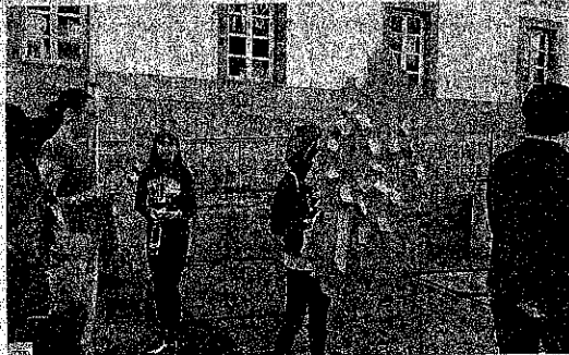
Un alto en el camino para expresar sensaciones en el árbol de los deseos.

En la calle Príncipe, frente a la sede del Marco, justo a mitad de recorrido, se habilitó la zona de afeitado para reponer fuerzas con un poco de agua. Los participantes aprovecharon para decorar el árbol de los deseos con pensamientos y frases emotivas que expresan sentimientos a flor de piel y sensaciones que despierta esta marcha.